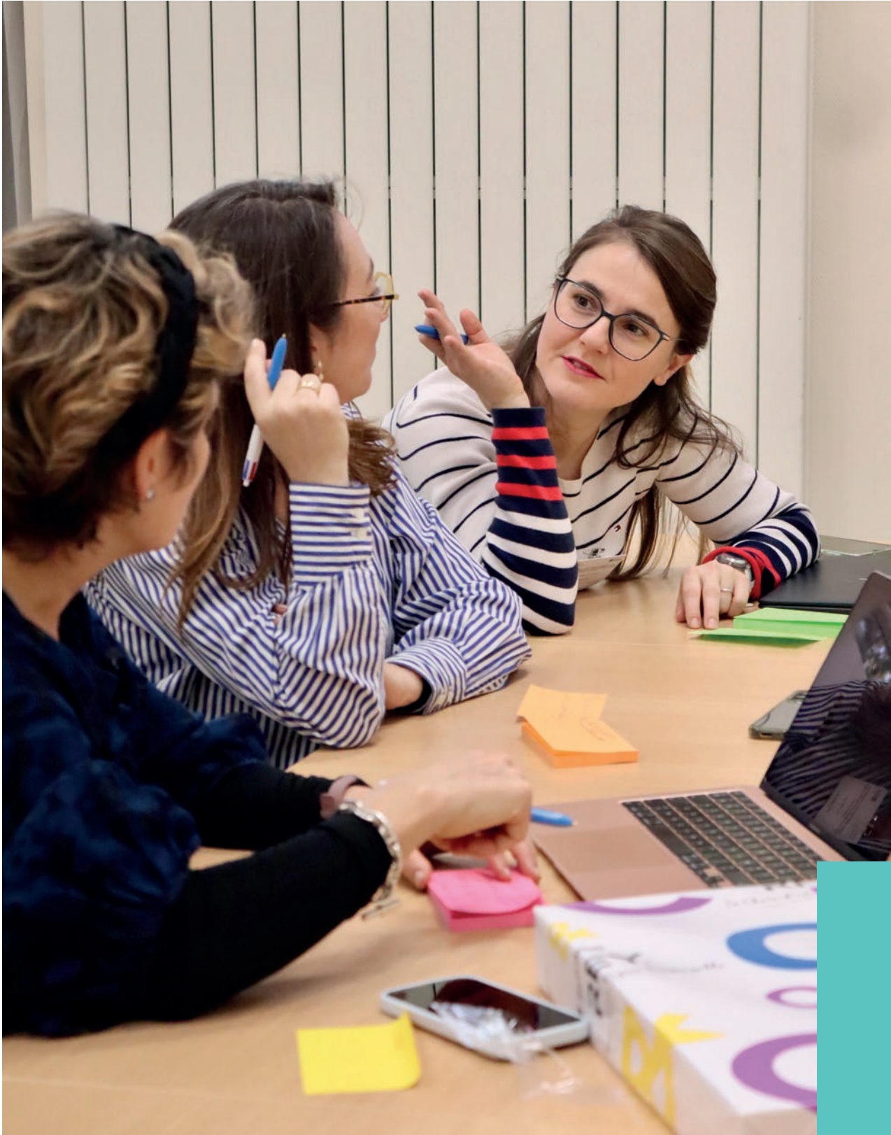
Above / Au-dessus Participants taking part in the design thinking sessions. / Participants aux sessions de design thinking .