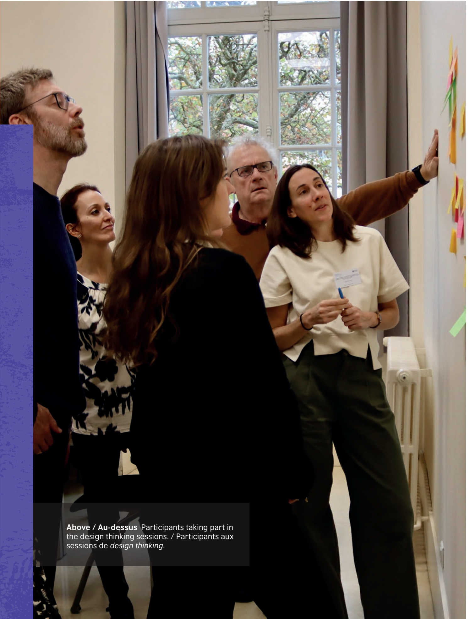
Above / Au-dessus Participants taking part in the design thinking sessions. / Participants aux sessions de design thinking .