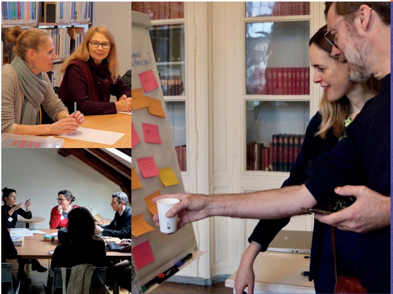
Above / Au-dessus Participants taking part in the design thinking sessions. / Participants aux sessions de design thinking .