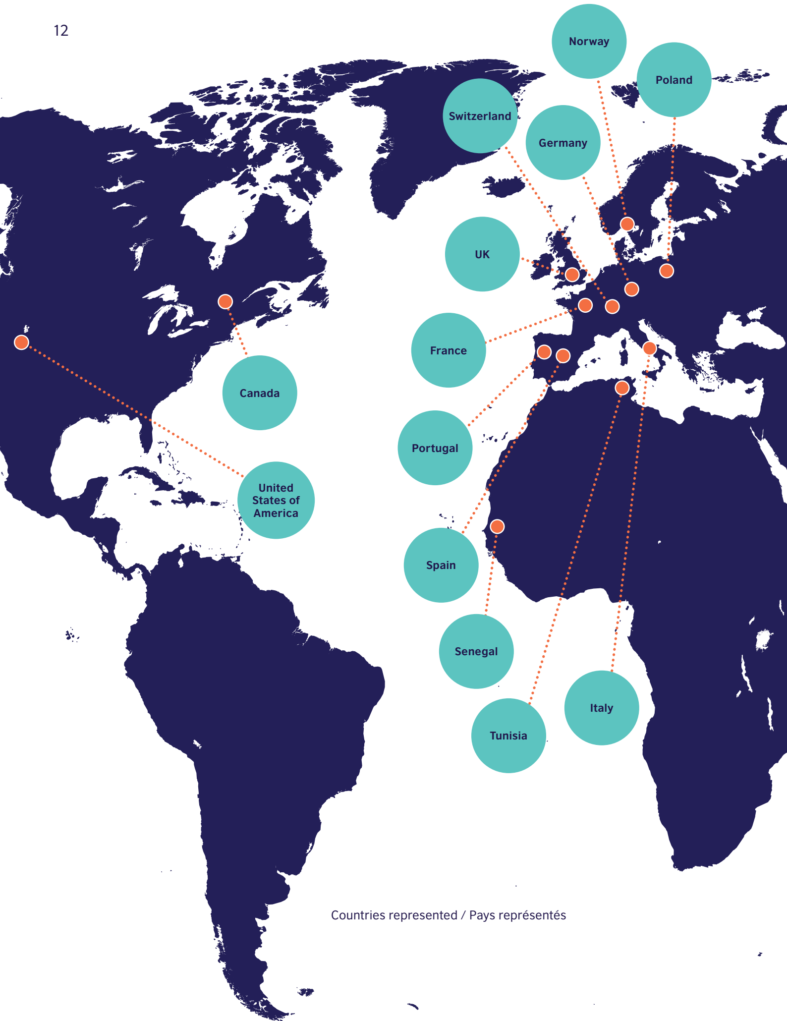
Countries represented / Pays représentés