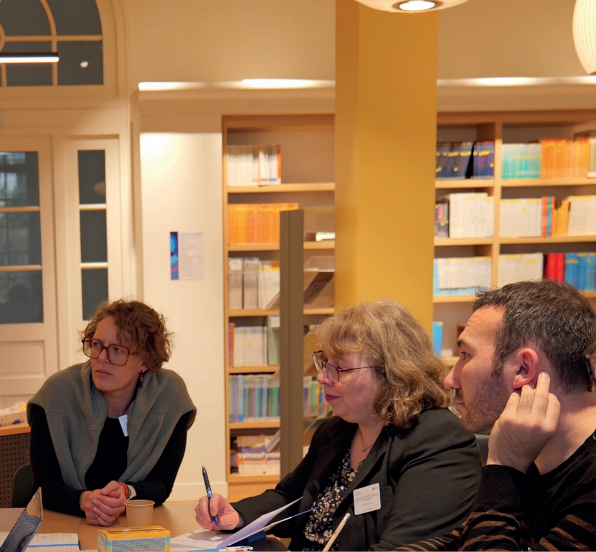
Above and right / Au-dessus et à droite Participants taking part in the design thinking sessions. / Participants aux sessions de design thinking .